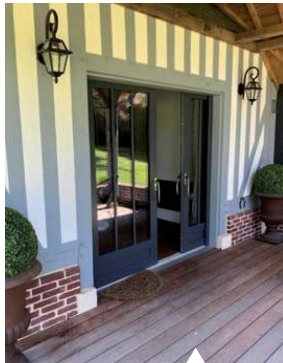
Baie coulissante à galandage Finition peinture